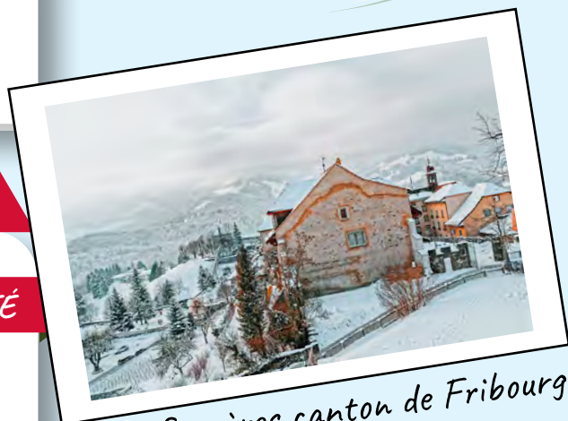
Gruyères canton de Fribourg

La recette a été reprise en ANGLETERRE avec le Carrot Cake.