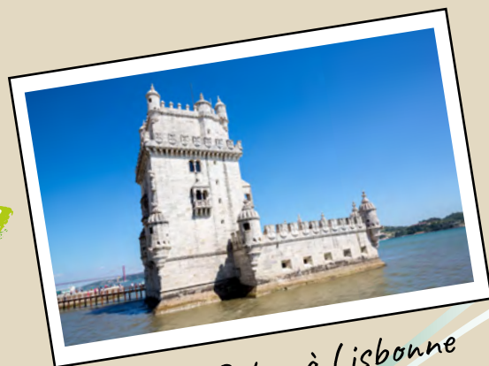
Tour de Belem à Lisbonne

La CALDEIRADA de PEIXE est une BOUILLABESSE à la Portugaise.